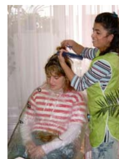
Frisieren macht Spaß