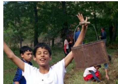
Freude über die erste Ernte