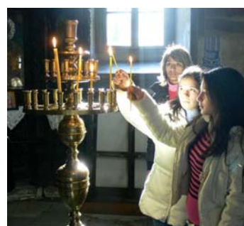
Vorweihnacht Kinder in Kirche