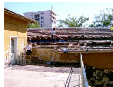
Reparatur Dach alter Speiseesaal