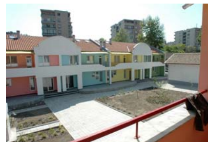
das Heim 2007