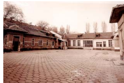
das Heim 1997

Schon bei einer unserer letzten Reisen hatten zwei Mädchen einen Wunsch geäußert: „Können wir einen Briefkasten an unserem Haus haben?“ „Warum wollt ihr einen Briefkasten? Ihr bekommt Eure Post doch von der Heimleitung?“ „Das ist nicht dasselbe“, antwortete eines der Mädchen. „Sie haben doch auch einen Briefkasten? Zuhause ist, wenn man einen Briefkasten hat, an dem der eigene Name steht. Zuhause ist auch, wenn man einen Schlüssel besitzt zu einer Tür, hinter der man zu Hause ist.“ Kaum ein anderes Gespräch verdeutlichte uns mehr, dass die Kinder die neuen Häuser wirklich als ihr Zuhause anzunehmen beginnen. Die Briefe Ihrer Paten selbst aus dem Briefkasten holen zu können, „so wie normale Kinder mit Familien auch“, ist ihnen offensichtlich sehr wichtig.